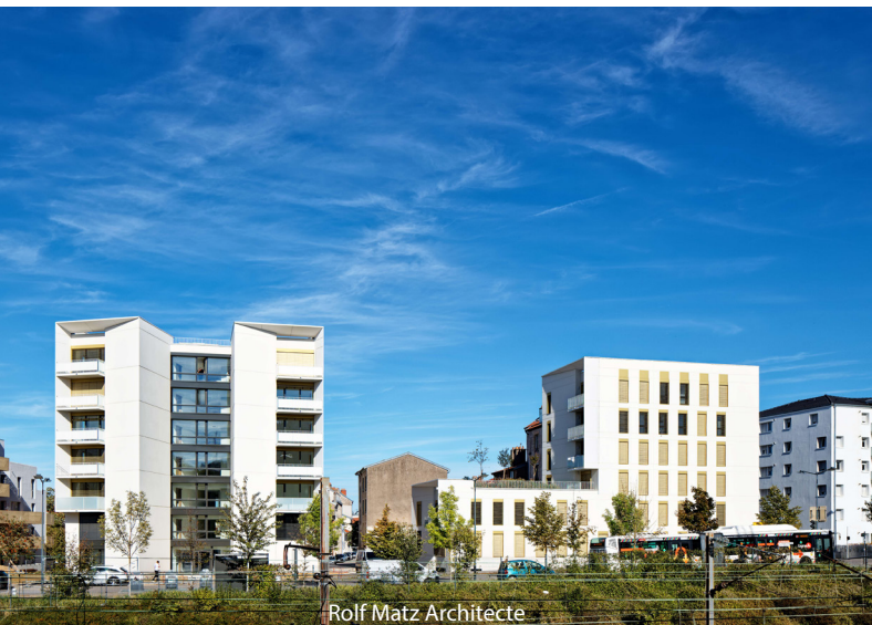
Rolf Matz Architecte