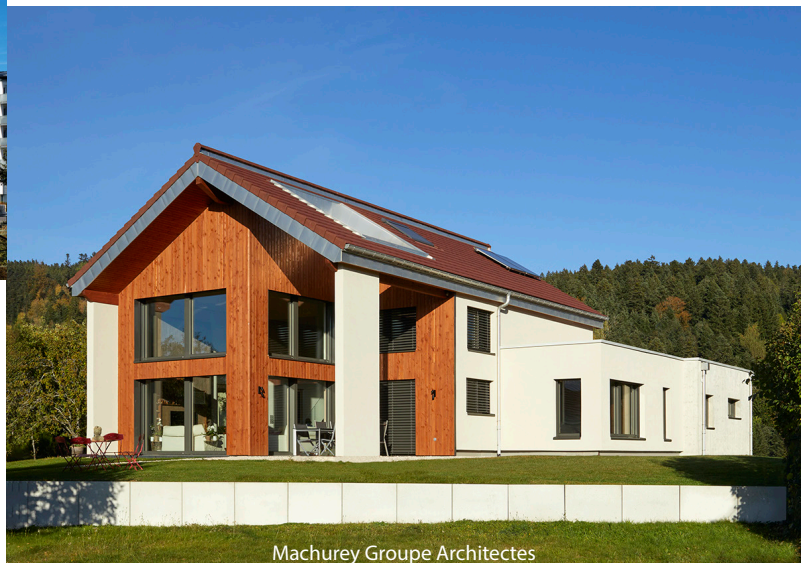
Machurey Groupe Architectes